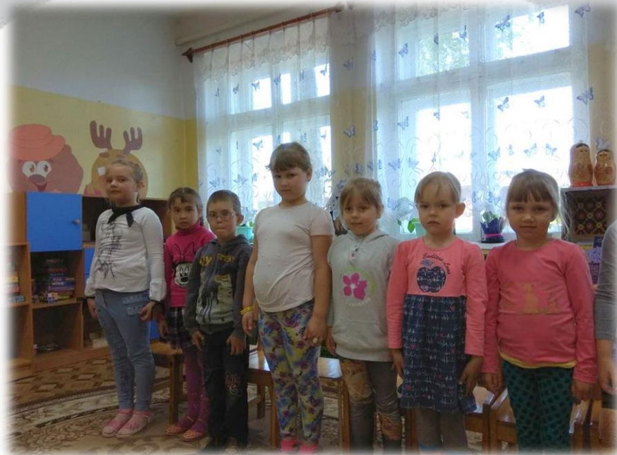
Прослушали гимн России.